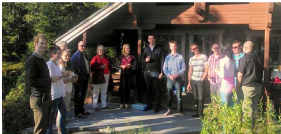
Yngre och äldre Agro-Forstare på sommarträff i Larsmo

Det är faktiskt möjligt att studera ganska mycket på svenska och man försöker hela tiden utveckla kursutbudet genom samarbete och nya innovativa idéer. Många av kurserna är ganska allmänna kurser såsom statistik, nationalekonomi och vetenskapsfilosofi, men det finns även flera tvärvetenskapliga och institutionsvisa kurser som går