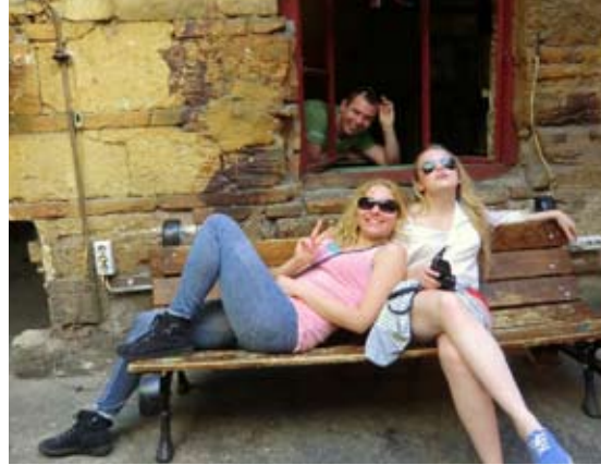
Glada Agro-Forstare på exkursion i Budapest 2013

Svenska studenters Agroforstförening är en förening för alla svenskspråkiga studenter vid Agrikultur-forstvetenskapliga fakulteten. Vår stolta förening grundades 1919 och har sedan dess samlat ihop en massa fina traditioner som nu berikar Agroforstarnas studieliv, bl.a. i form av exkursioner, idrott och sitsar (fester). Årligen återkommande fester är årsfesten, gulnäbbsintagningen, julfesten och sommarträffen. Men utöver detta sker det hela tiden någonting kul. Med i vårt glada gäng finns bl.a. livsmedels-, miljövårds-, mikrobiologie-, ekonomie-, teknologie-, lantbruks-, näringsvetenskaps- och skogsbruksstuderanden. Råkar du vara en svenskspråkig veterinär-