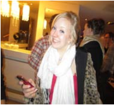
Helmi Kärjä Oikos ry